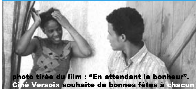
photo tirée du film : "En attendant le bonheur". Ciné Versoix souhaite de bonnes fêtes à chacun

Sur la côte mauritanienne, là où le désert rejoint l'océan, Nadhibou est une ville de transit où de nombreux Africains séjournent, comme Abdallah, avant de se rendre à l'étranger. Ces espaces frontières sont appelés par les Maliens, Heremakono (littéralement : en attendant le bonheur). «Ce film à dimension autobiographique sur la coupure (de communication, d'espace, de courant) témoigne d'un sens de l'absurde exceptionnel et d'un don burlesque réel...» Positif. Prix de la critique, Cannes.